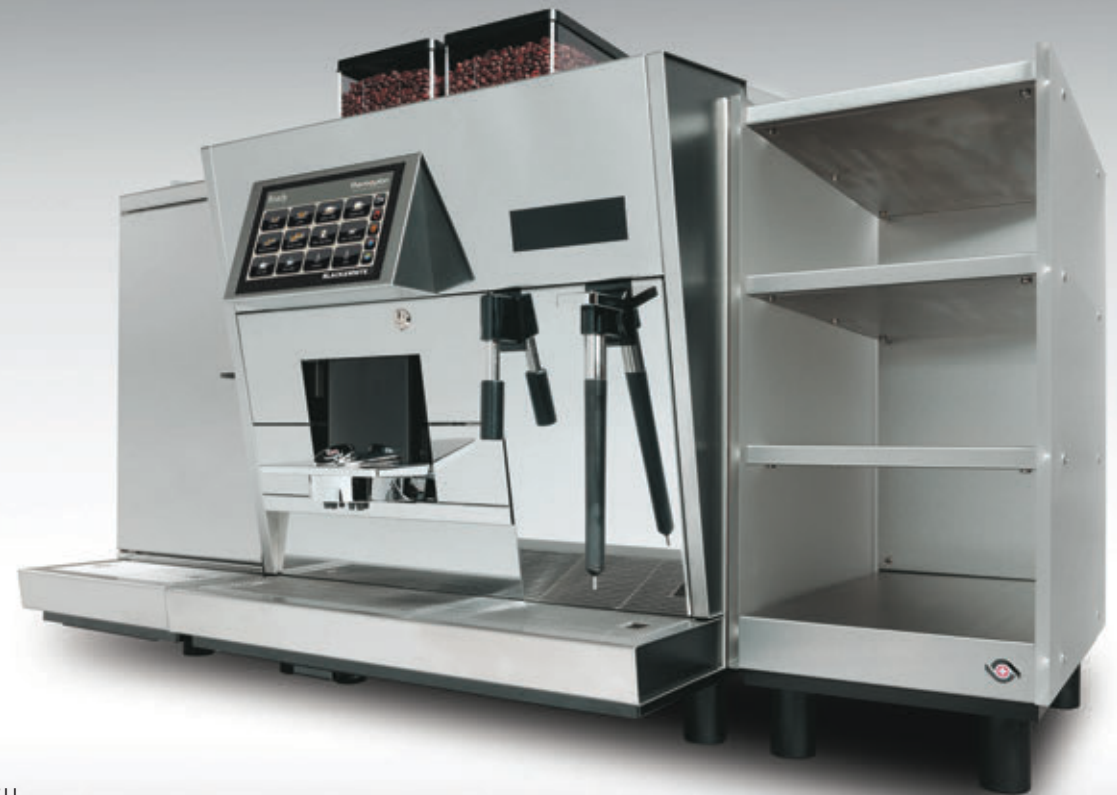
CTMS & CH

Mit dem CH werden die Kaffeetassen vorgewärmt um die perfekte Grundlage eines vollendeten Kaffeegenusses zu erhalten.