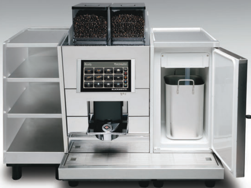
CTM & CH